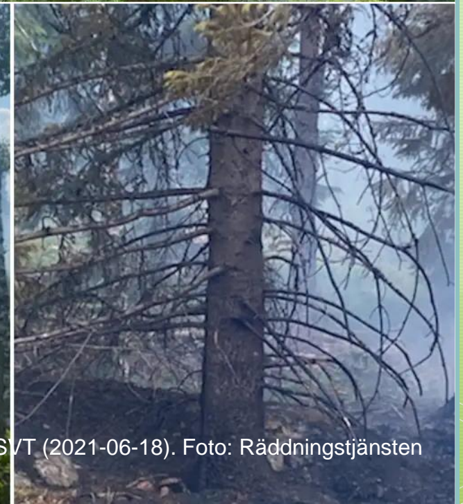
Brand i Lönneberga, Hultsfred. SVT (2021-06-18).