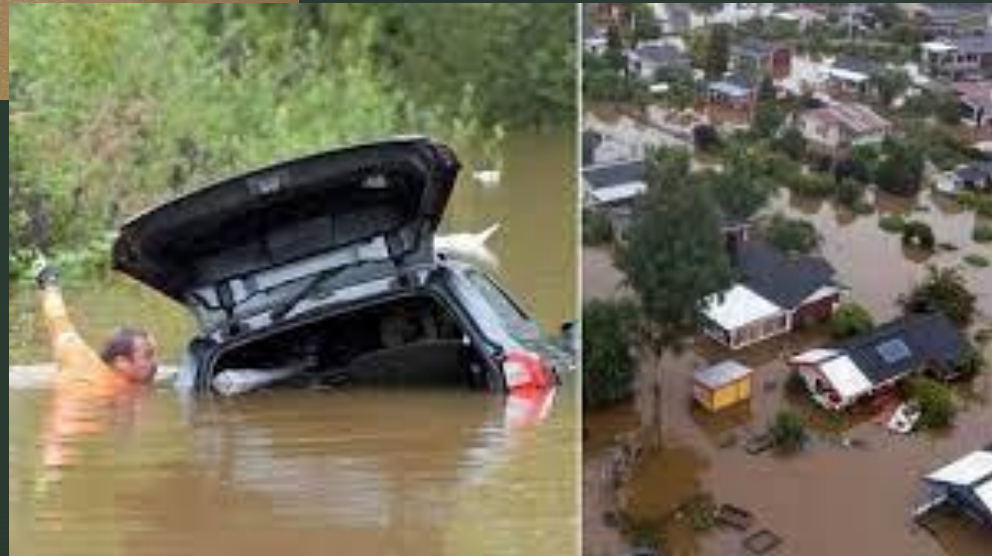
Falun & Gävle augusti 2021. SVT 2021-08-20.