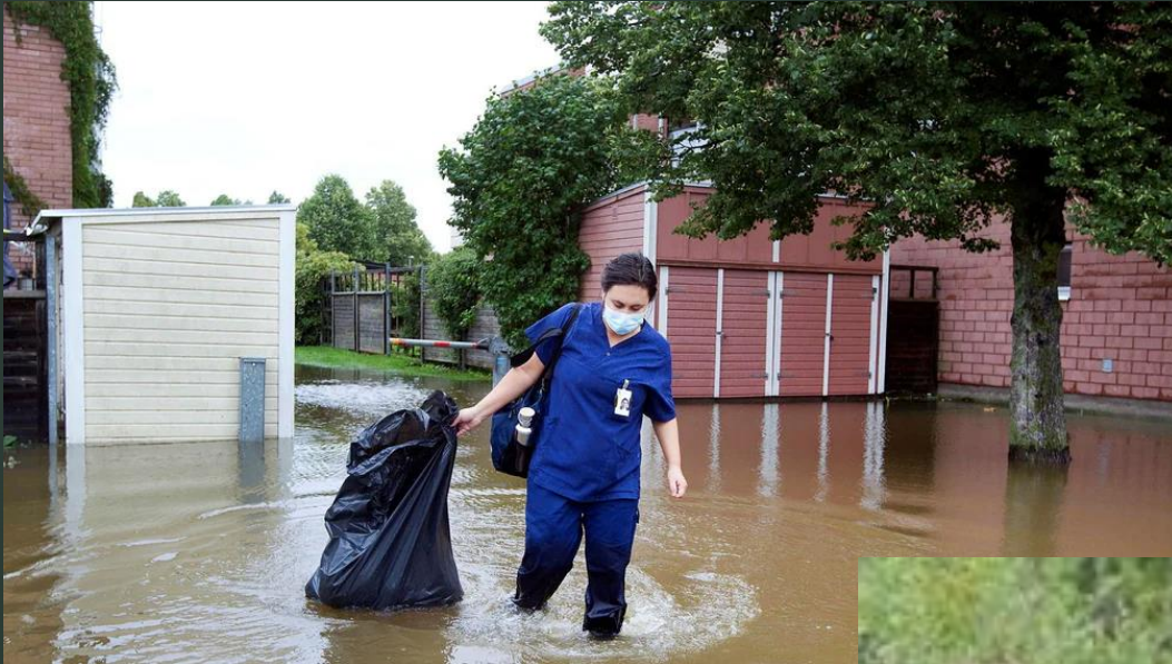
Gävle augusti 2021.