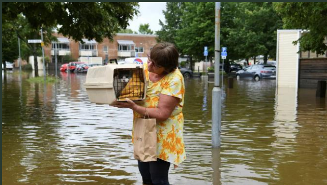
Gävle augusti 2021.