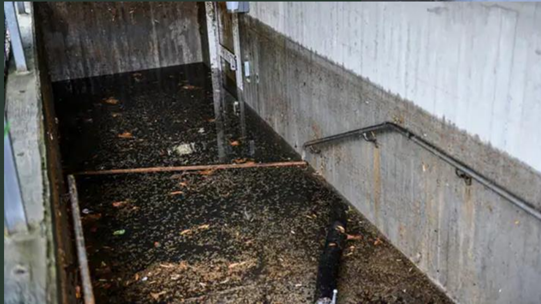
Oxhagen & Skälby, Kalmar. Sveriges Radio. (29 aug. 2021).