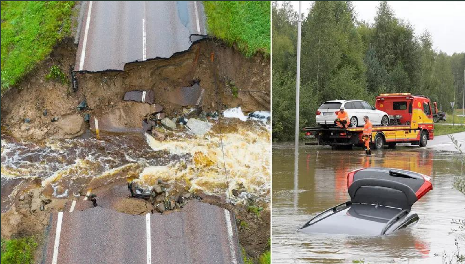
I närheten av Romme Alpin, mellan Borlänge och Smedjebacken. SVT (2021-08-20)