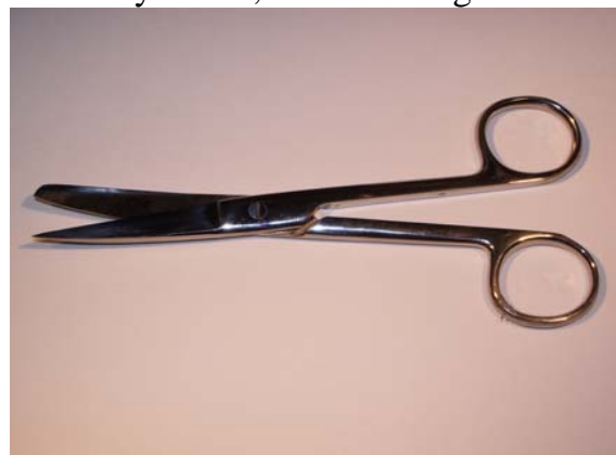
Sax böjd, spetsig/trubbig