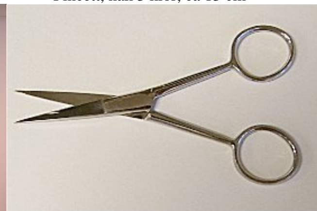
Sax ögon, rak