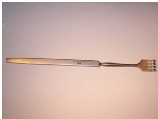
Sårhake med fyra klor, ca 22cm lång