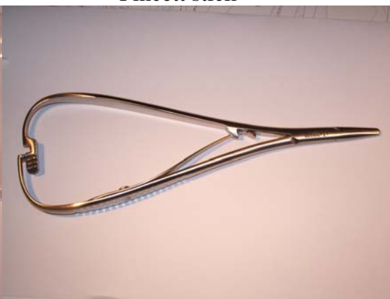
Nålförare, ca 17 cm lång