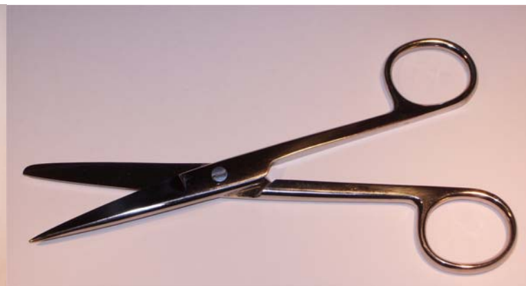
Sax kirurgisk, spetsig/trubbig