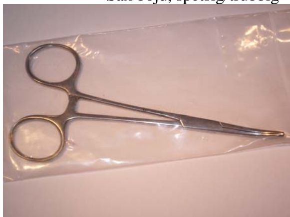
Peang böjd, ca 16 cm