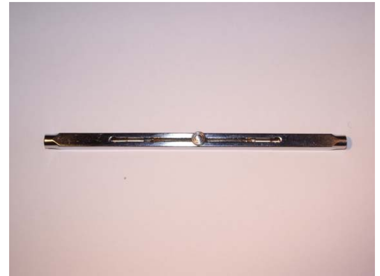
Ögoninstrument för borttagande av främmande kropp