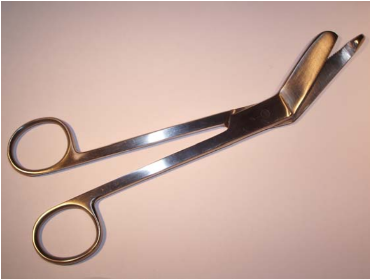
Sax Esmarch, ca 20 cm