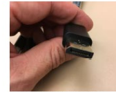
Figure 4: A close-up photograph of a person's hands holding a small, dark, rectangular object, similar to Figure 1, showing another angle.