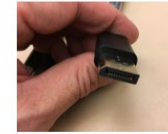
Figure 1: A close-up photograph of a person's hands holding a small, dark, rectangular object, likely a component or tool used in the practice.

Praktikplats(-er) Beskriv t.ex. arbetsplatsernas verksamhet, geografi, tjänster/produkter