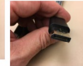
Figure 2: A close-up photograph of a person's hands holding a small, dark, rectangular object, similar to Figure 1, showing a different angle or use.

Arbetsuppgifter Beskriv exempel på vad du fick