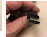
Figure 5: A close-up photograph of a person's hands holding a small, dark, rectangular object, similar to Figure 1, showing yet another angle.