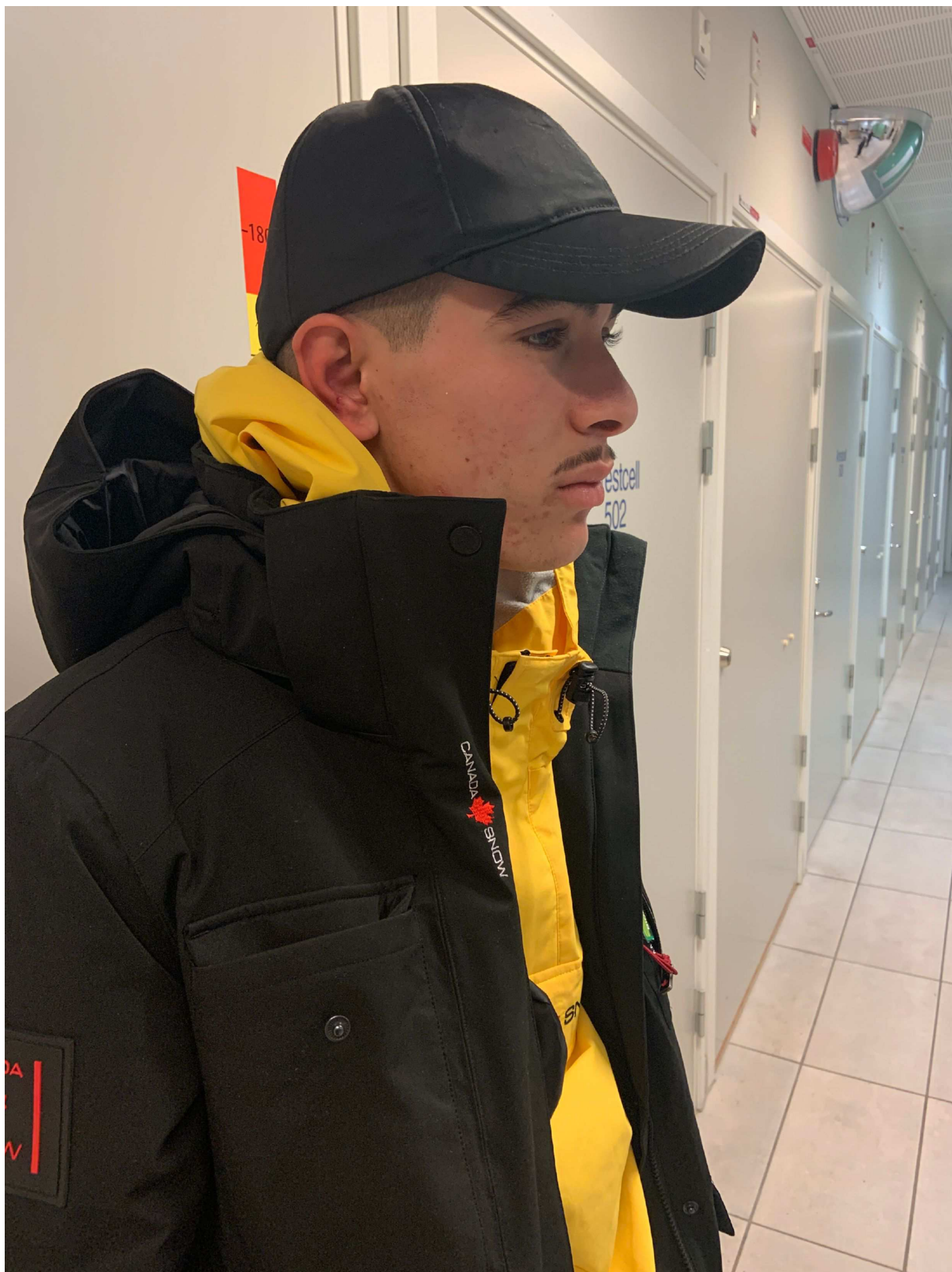
7. Foto i profil höger sida