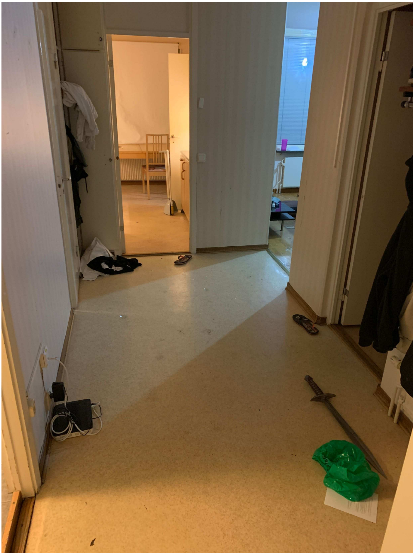
4. Foto över lägenheten. Till höger i bild syns ett till svärd.