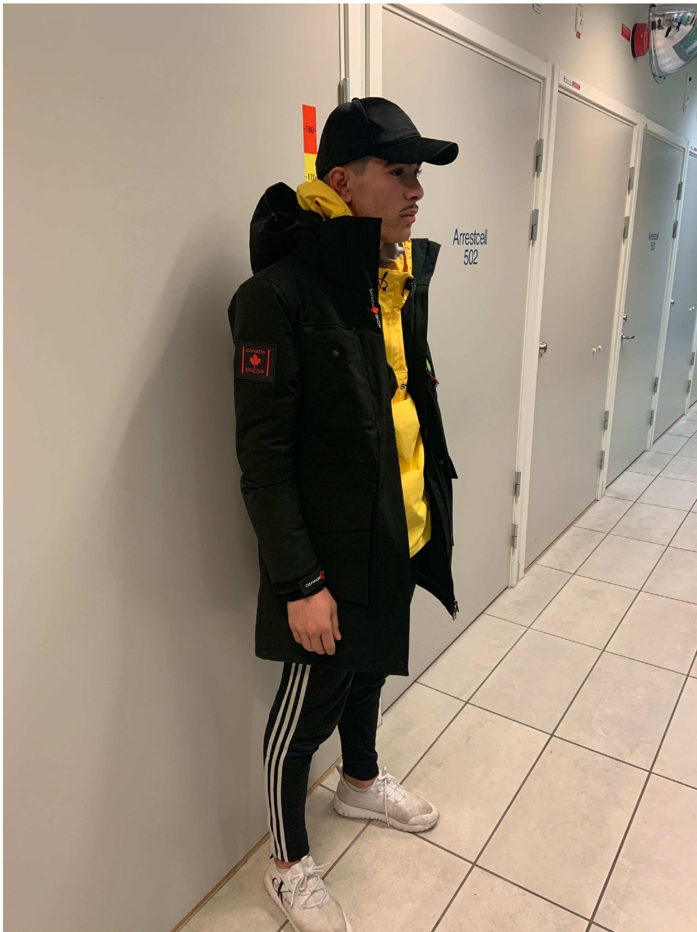
2. Foto i profil höger sida