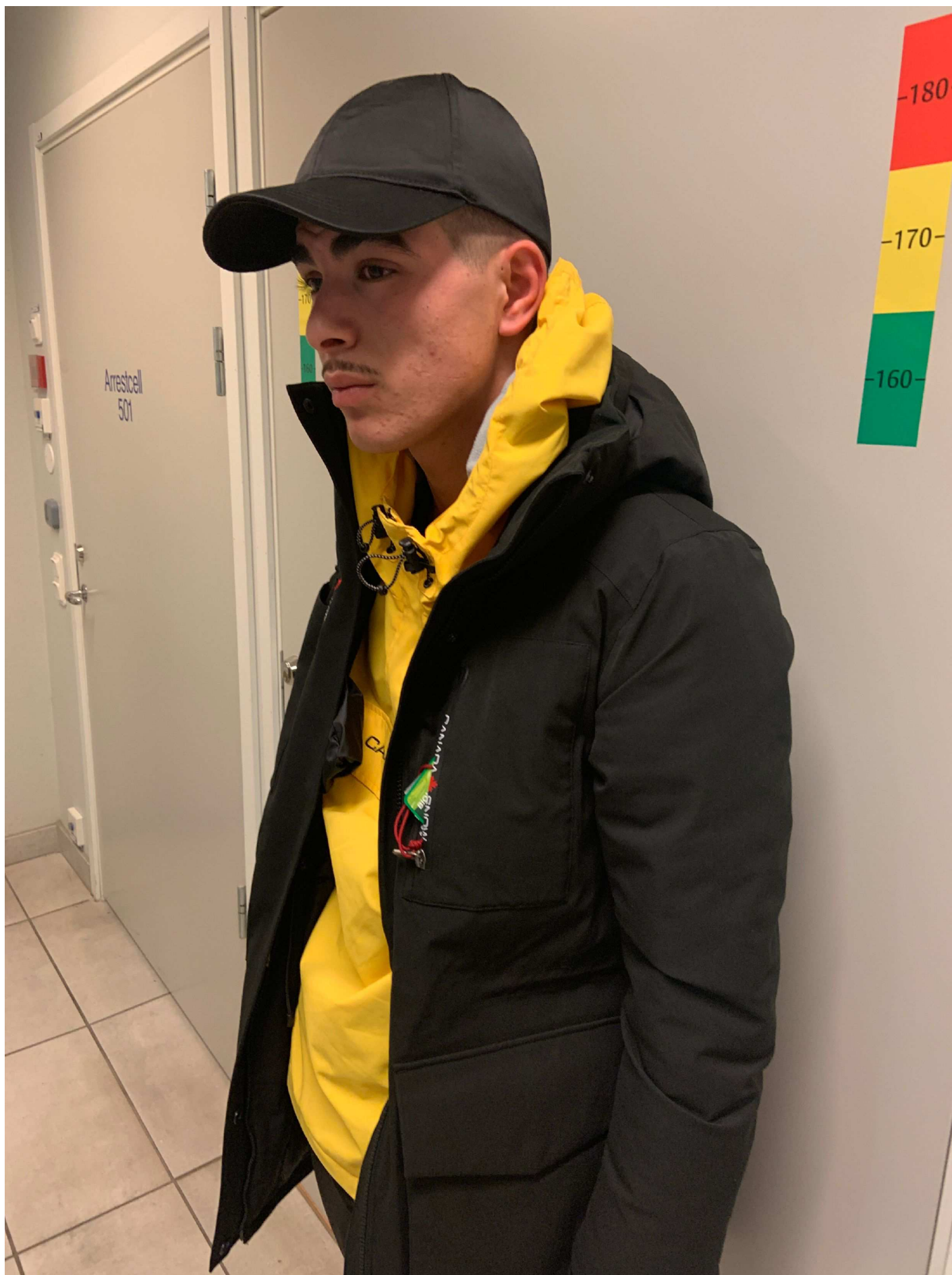
5. Foto i profil vänster sida