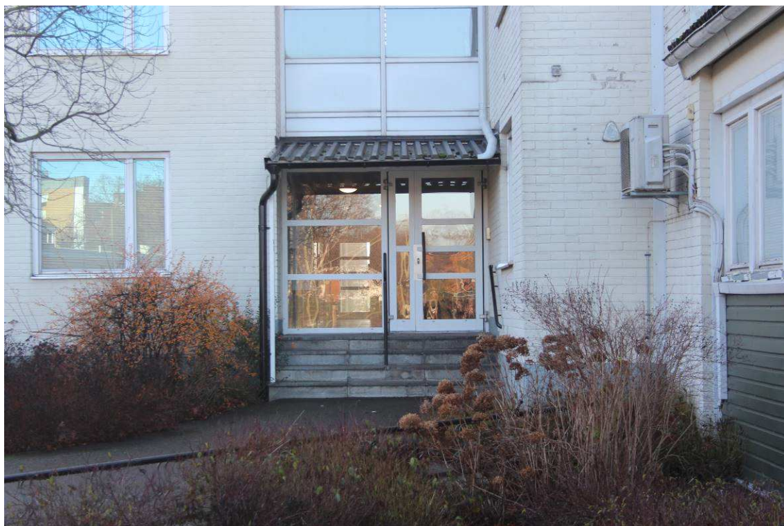
Bild 3. Norra entrén med lägenheten direkt till höger innanför dörren.