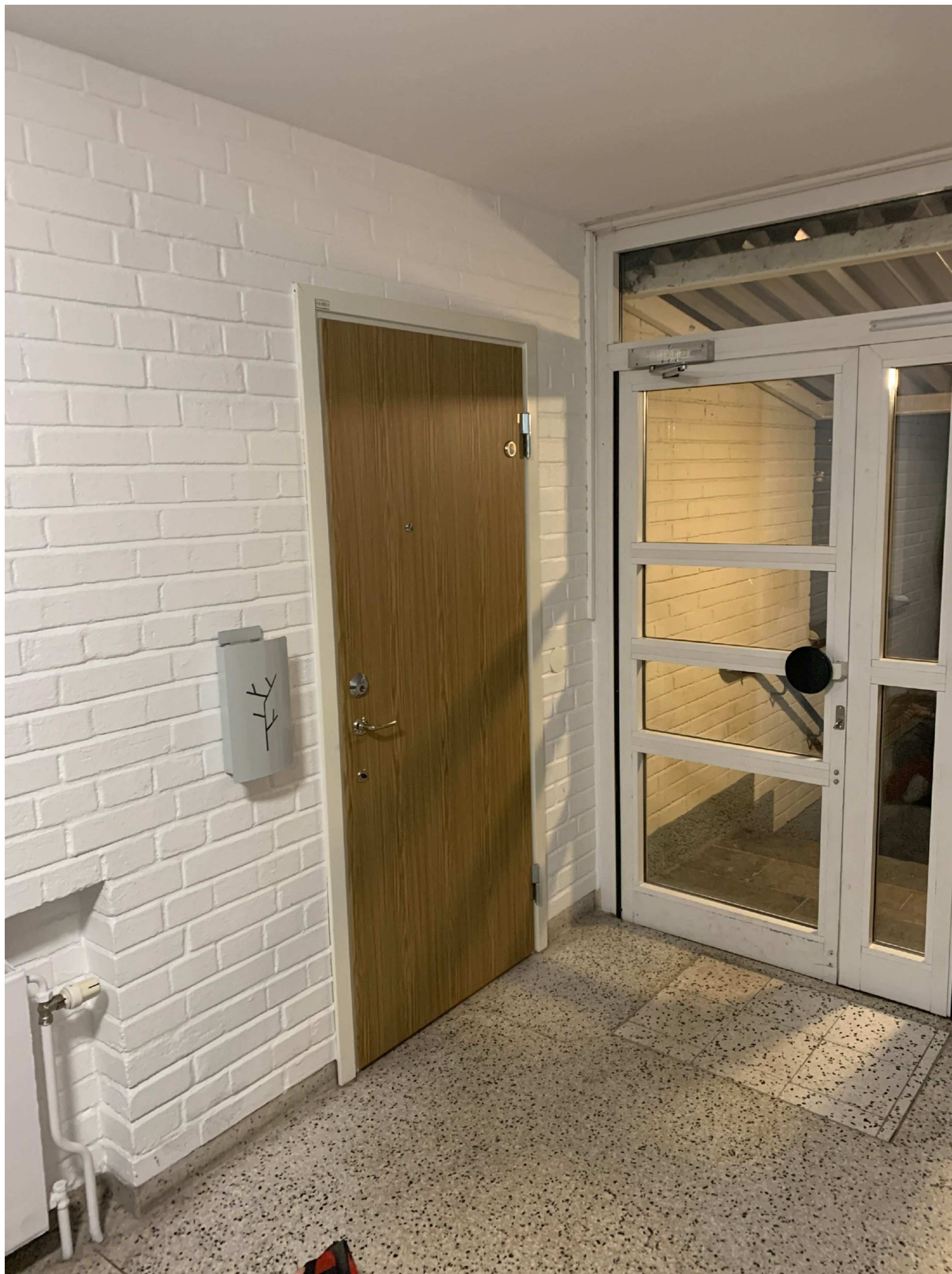
2. Översiktsfoto utav dörren in till lägenheten och platsen där MT angrep polisman med svärd.