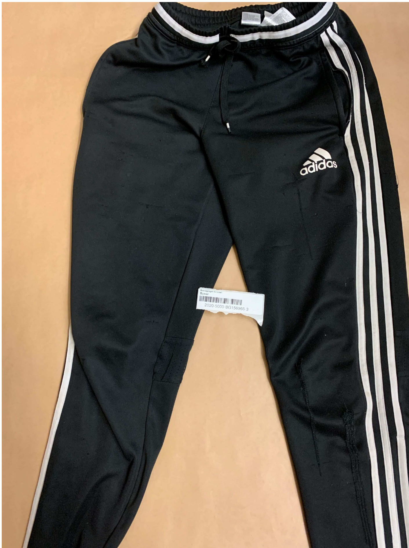
3. Foto beslag , BG156966-3