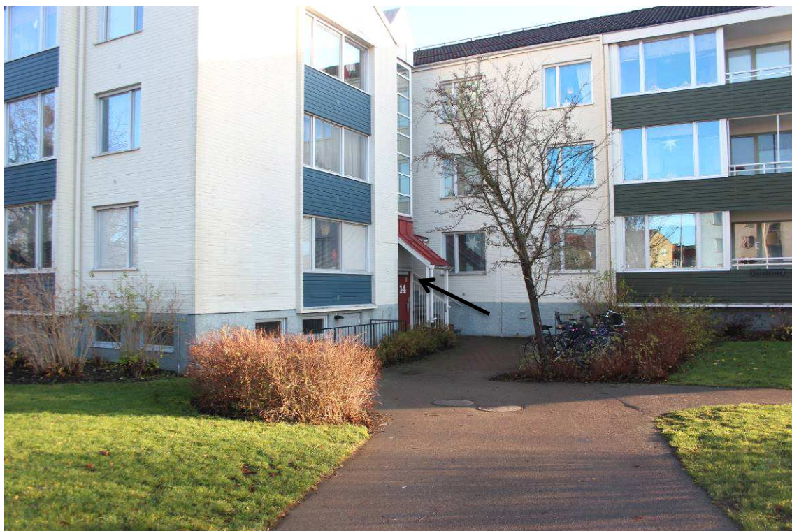
Bild 2. Södra entrén till trapphuset.