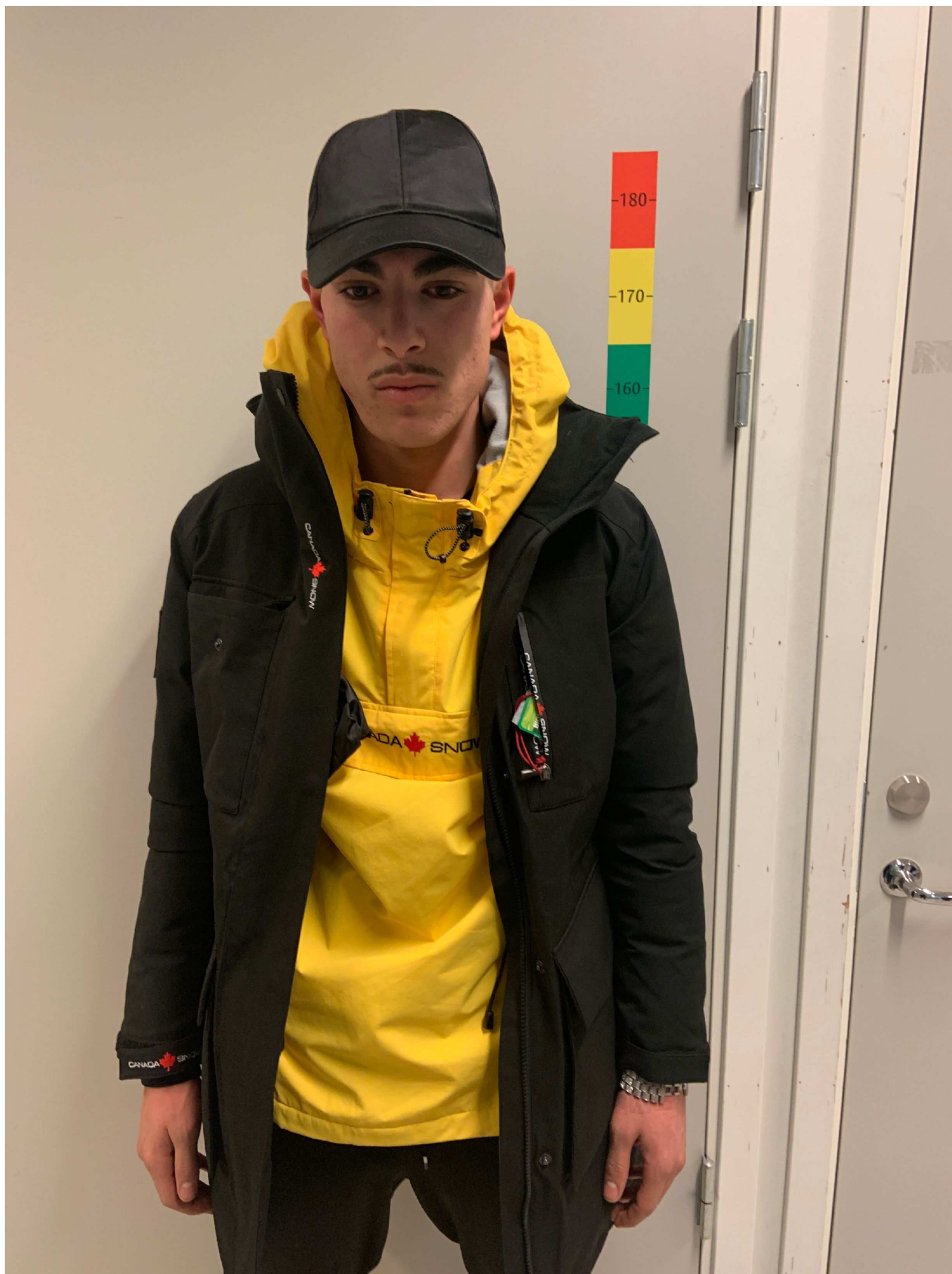
3. Aktuell klädsel vid brottstillfället, foto taget framifrån.