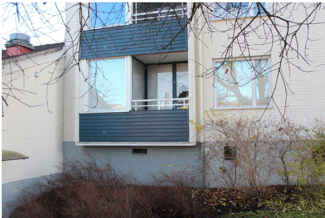
Bild 4. Balkongen till aktuell lägenhet.