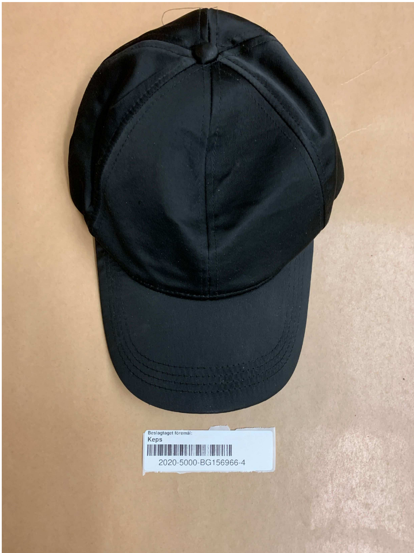
4. Foto beslag , BG156966-4