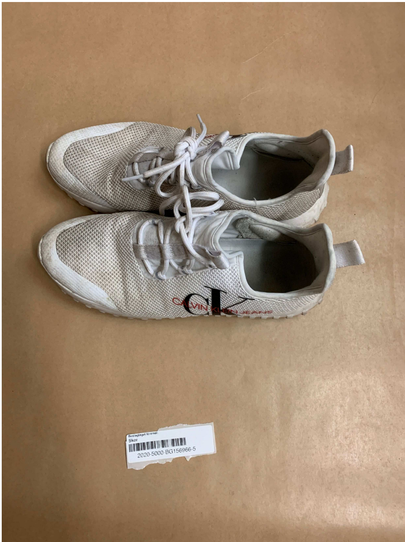
5. Foto beslag , BG156966-5