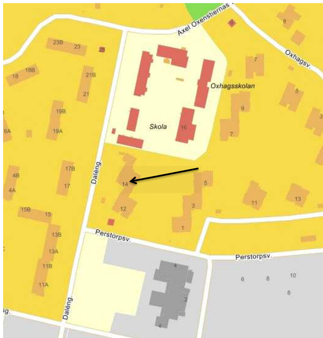
Bild 1. Översikskarta