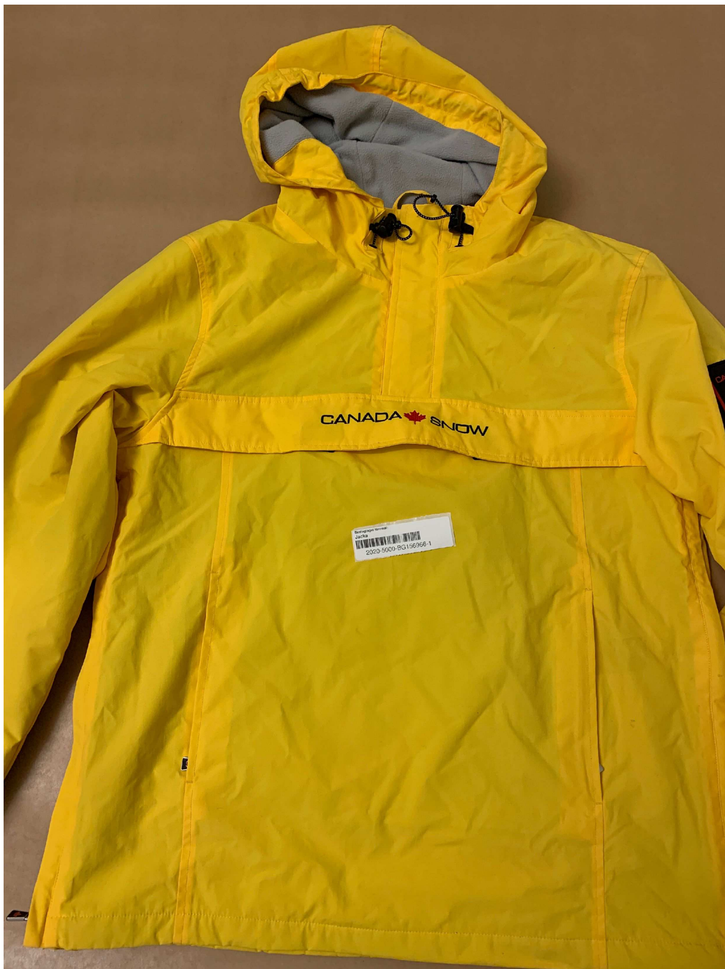
1. Foto beslag , BG156966-1