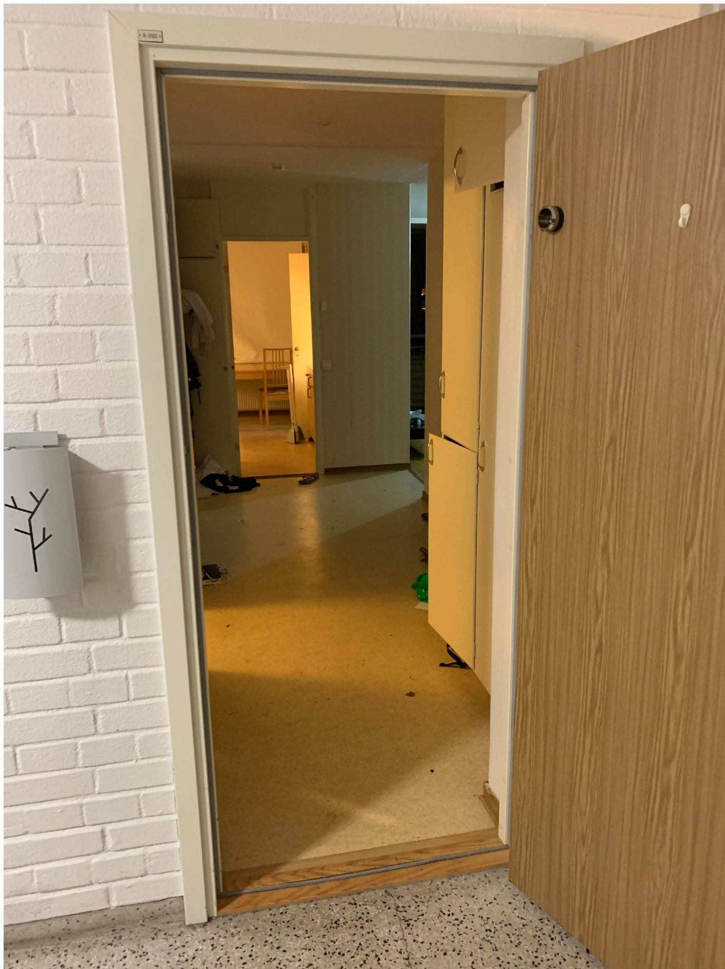
3. Översiktsfoto utav dörren in till lägenheten och platsen där MT angrep polisman med svärd.