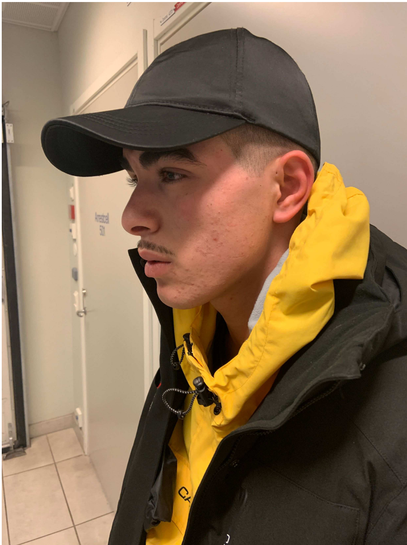
6. Foto i profil vänster sida