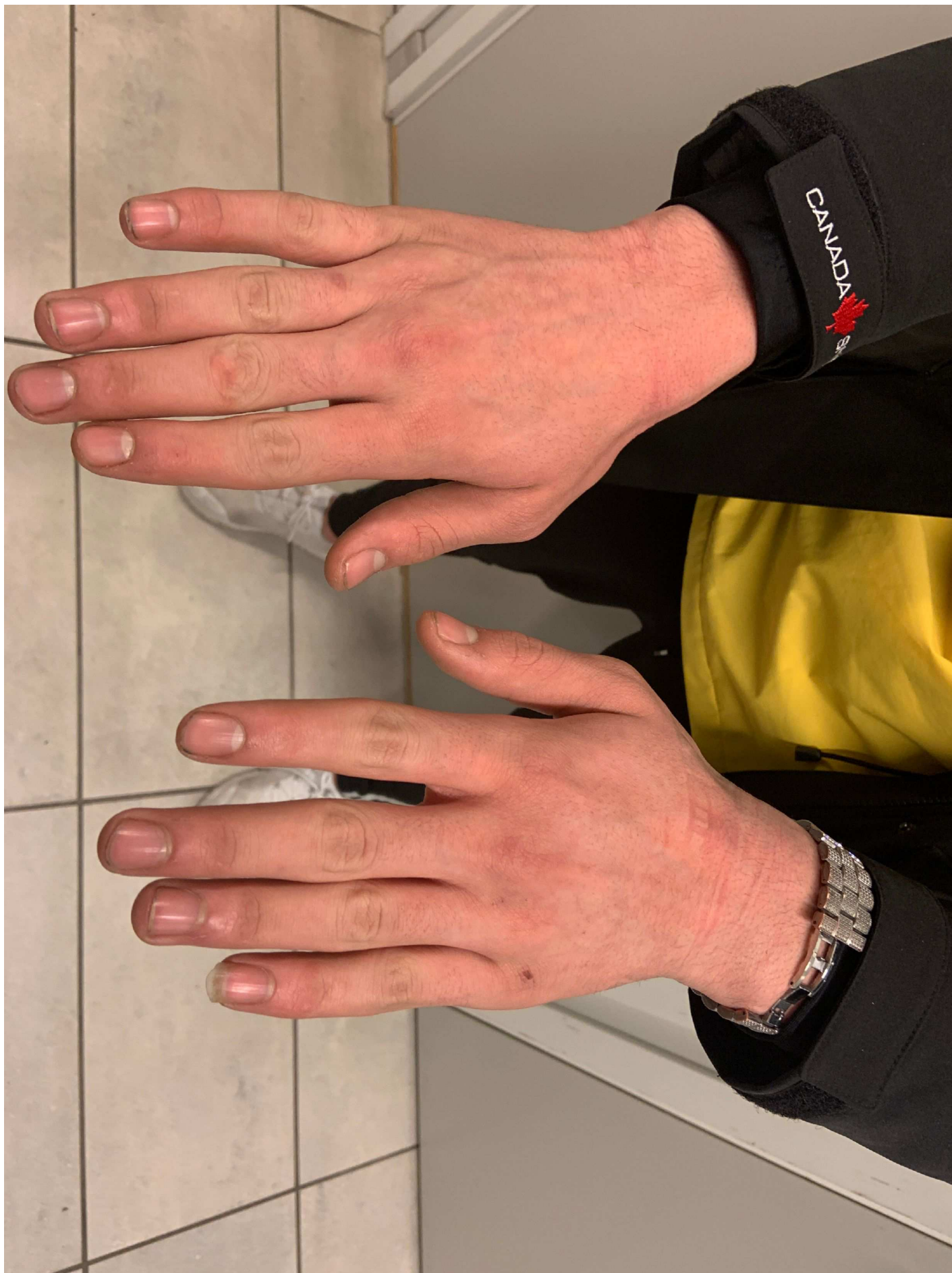
8. Misstänktes händer