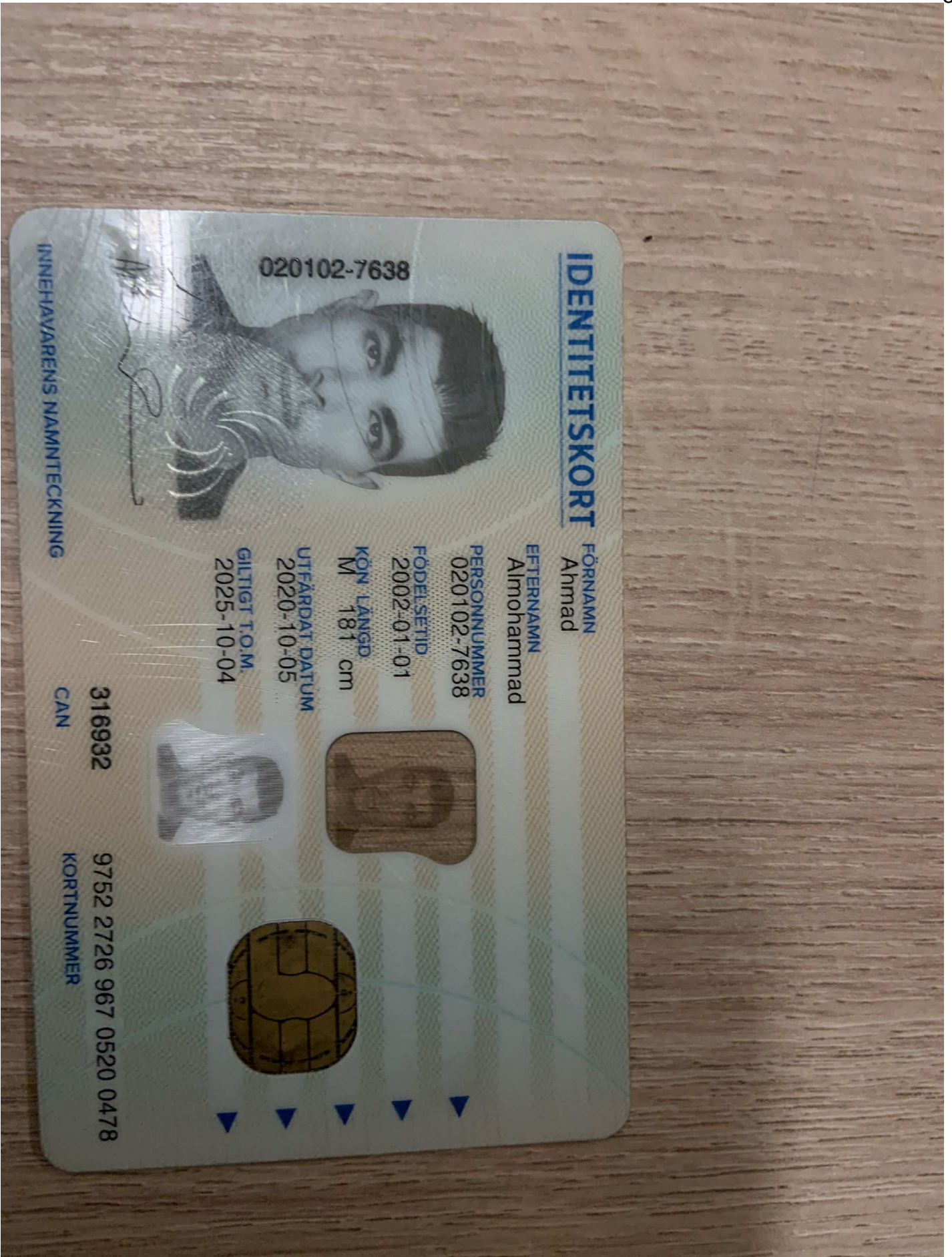
10. ID-kort på misstänkt