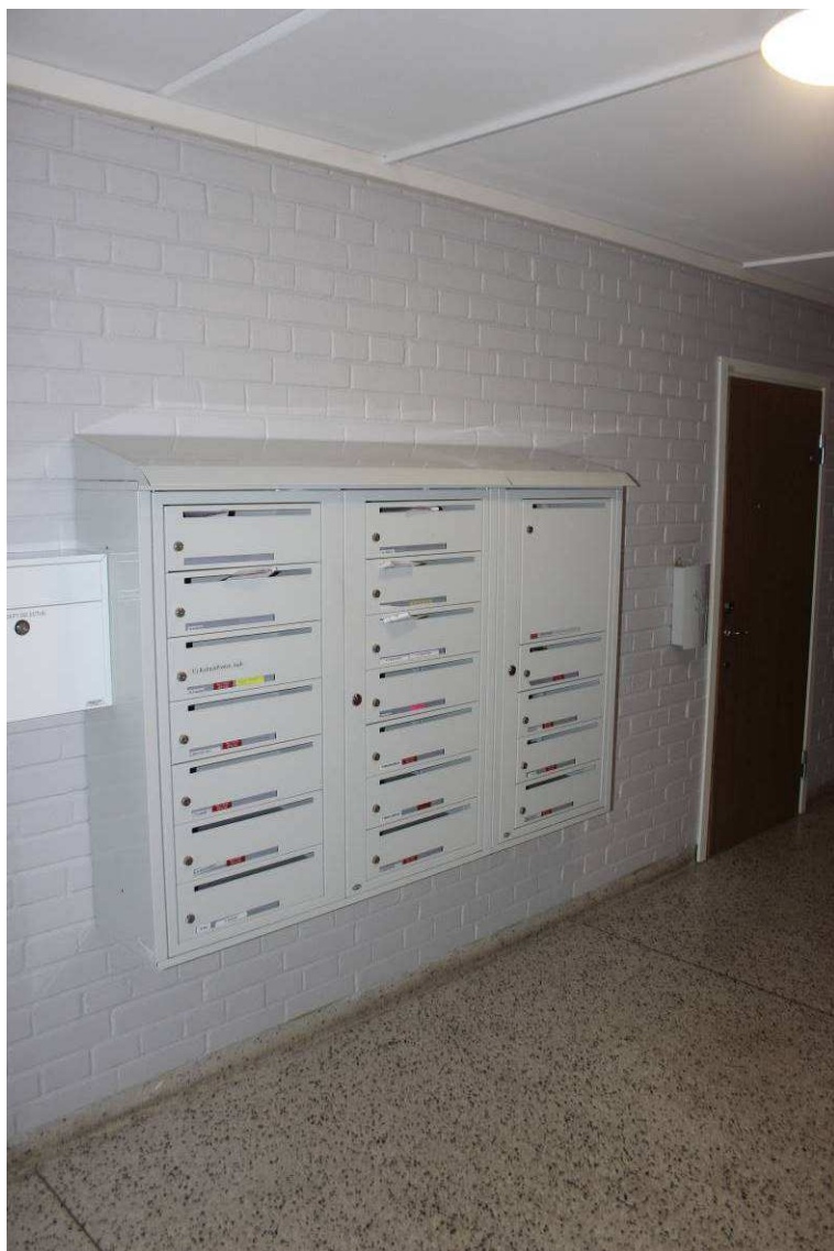
Bild 6. Foto från aktuell lägenhetsdörr mot postfacken.