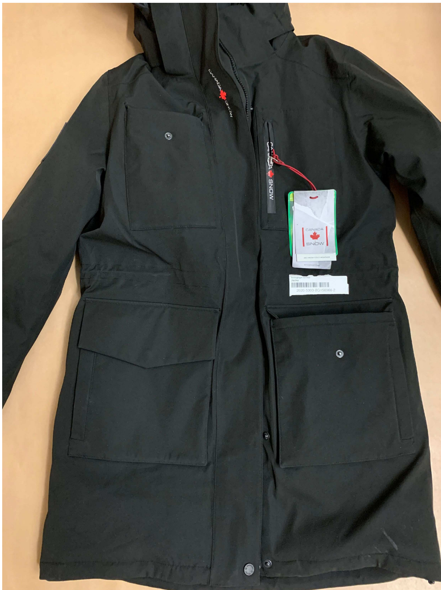
2. Foto beslag , BG156966-2