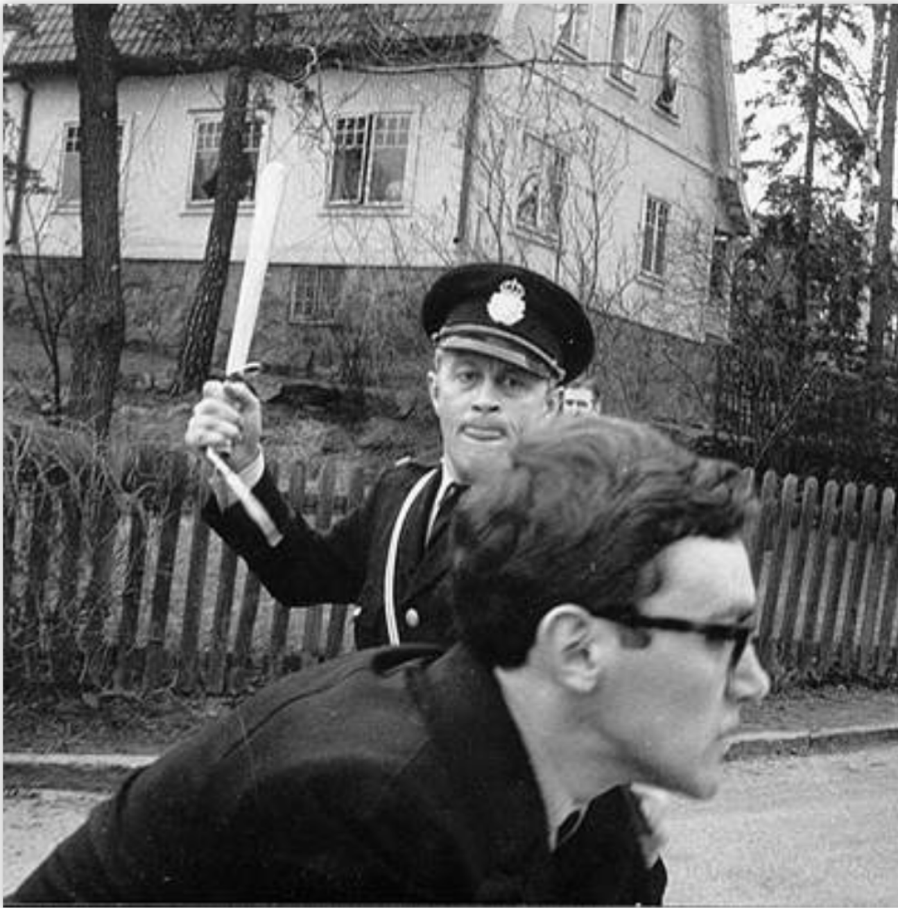
Polisingripande mot en Vietnamdemonstration vid finansministermötet på hotell Foresta på Lidingö 1968